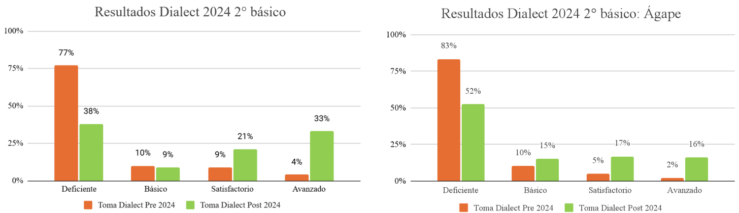
Figura 2. Distribución en categorías Dialect 2024, 2° básicos